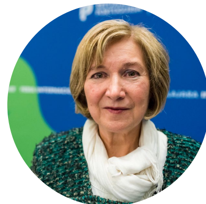
La escritora Lidia Jorge, durante la fil Guadalajara 2019.

Dotado con 150 mil dólares estadounidenses, el Premio FIL reconoce una vida de entrega a la literatura.