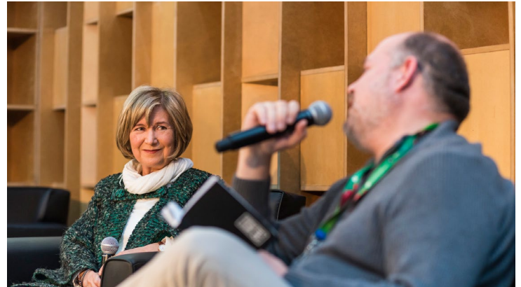
La escritora portuguesa durante una entrevista en Guadalajara.

Su obra ha sido traducida a diversas lenguas, y en español destacan Noticia de la ciudad silvestre (1999, Alfaguara), El fugitivo que dibujaba pájaros (2000, Seix Barral), El jardín sin límites (2001, Alfaguara), La costa de los murmullos (2001, Alfaguara), Los tiempos del esplendor (2017, La Umbría y la Solana), Los memorables (2019, Elefanta) y Estuario (2019, La Umbría y la Solana). Lidia Jorge fue una de las autoras que formaron parte de la delegación literaria de Portugal, país Invitado de Honor de la Feria Internacional del Libro de Guadalajara 2018.