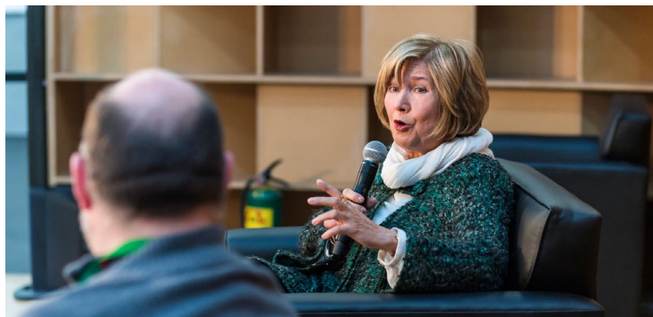
Lidia Jorge participó en diversas actividades en la pasada FIL Guadalajara.

rumana en la Universidad de Bucarest (2001-2010), donde se doctoró en 2010 con una tesis sobre la censura y la prensa cultural en la dictadura comunista de Rumanía. Entre 2010 y 2014 fue directora adjunta del Instituto Cultural Rumano de Madrid. Ha publicado tres libros en Rumanía, traducciones literarias, prosas en antologías y artículos sobre literatura, y también, en los últimos años, comentarios políticos. Su libro más reciente, La noi dacii se lupta si astazi cu romanii. Portret de tara (Aquí los dacios y los romanos todavía están peleando. Retrato de país , Editorial Humanitas, 2020), es un ensayo sobre la actualidad política y cultural de Rumanía desde la perspectiva de un residente en España, con referencias a escritores clásicos rumanos y a la lucha entre dacios y romanos, conquistadores rechazados y admirados a la vez.